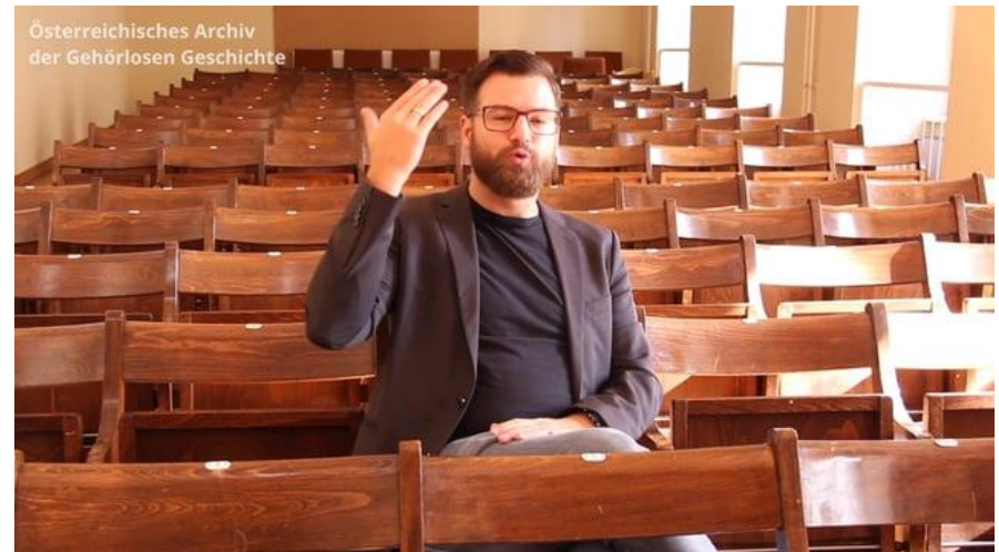
NEBA Maßnahmen werden aus Mitteln des Europäischen Sozialfonds finanziert. NEBA ist eine Initiative des Sozialministeriumservice.